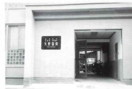
1950(昭和25)年 矢野医院 開設