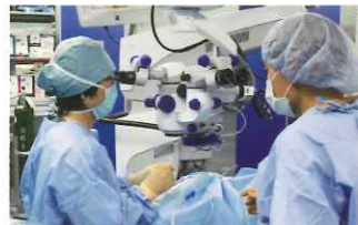
アイセンター 白内障手術

高度な機器を備え、専門スタッフが検査、治療から生活ケアまでトータルに行っています。