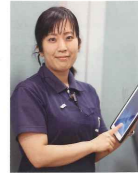
デイセンター 介護福祉士

デイサービスや特別養護老人ホームではインカムを導入しています。職員間の情報共有がスピーディーになり、業務効率アップと負担軽減に。そのほか、タブレットや見守りシステムの導入、介護記録システムなど最先端のICT技術を活用して、ケアの質の向上を目指しています。