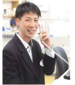
医療介護サービスセンター 介護支援専門員

医療と介護、両方のサービスを提供する洛和会ヘルスケアシステム。日頃から職員同士の顔の見える関係が築けており、スムーズな情報共有ができるので、利用者さんからは「全て任せられて安心」との声をいただいています。医療の専門職による勉強会もあり、より利用者さんのニーズに合ったケアプランの提供ができます。