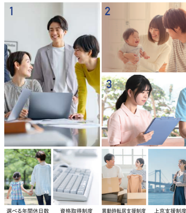
選べる年間休日数 資格取得制度 異動時転居支援制度 上京支援制度