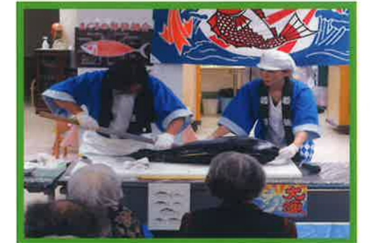
マグロ解体ショー