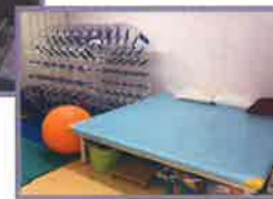
リハビリスペース