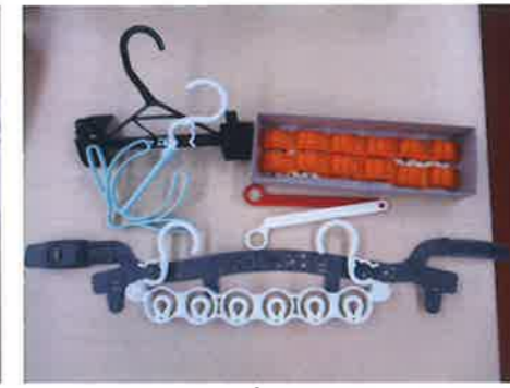
プラスチック加工