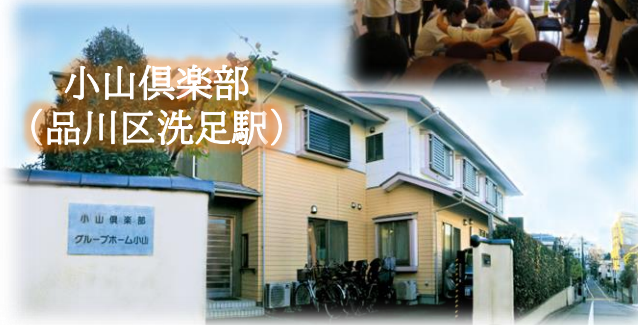
小山倶楽部 (品川区洗足駅)