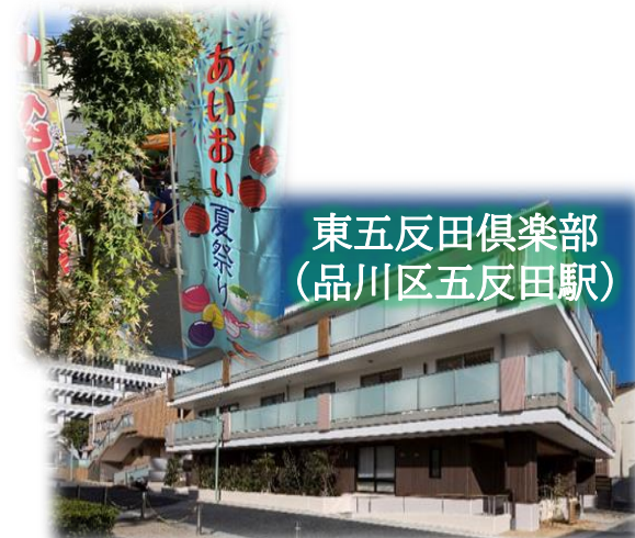
東五反田倶楽部 (品川区五反田駅)