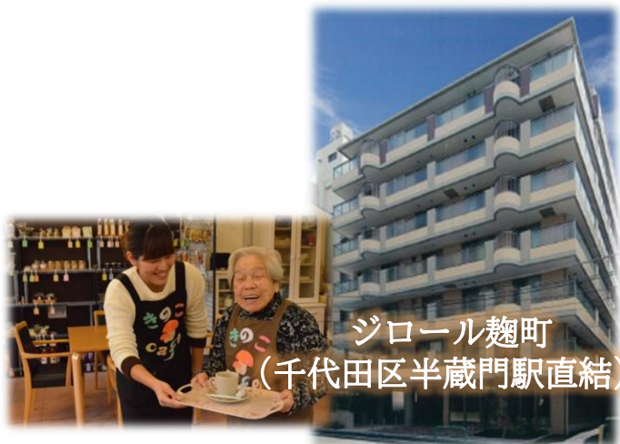
ジロール麹町 (千代田区半蔵門駅直結)