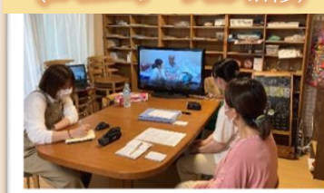
ビデオ検討会 (コミュニケーション研修)