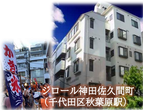
ジロール神田佐久間町 (千代田区秋葉原駅)

小規模な施設から大規模な施設まで…カラー様々都内5か所で展開中。 令和8年度には新規施設オープン予定！！