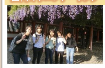
区内オリエンテーリング