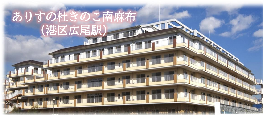
ありすの杜きのこ南麻布 (港区広尾駅)