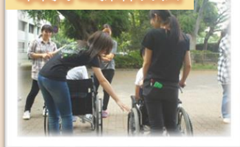
車椅子の操作方法