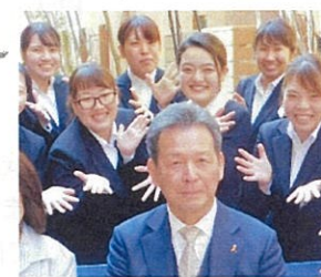
就任式で乳児院の新任職員と

令和元年、新しい時代がスタートしました。明治、大正、昭和、平成のそれぞれの時代を振り返りながら、継承すべき点を大切にしながら、令和に向かって新しい価値を創造していく。つまり「故きを温ねて新しきを知る」。四恩学園の「温故知新」の「故」は「セツルメントの歴史的实践」です。「新」は「包括的支援体制の構築」です。