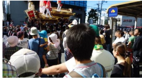
大好きなだんじり祭りへ友だちとヘルパーで出かけました

きやすい社会になることだと、私たちは確信しています。実現することは容易ではありませんが、私たちが日々行っている支援と、それらがつながってすすむ事業を通じて、わずかずつであっても近づいているという実感が私たちにはあります。