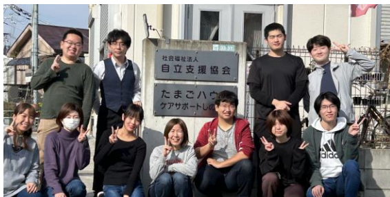
ある日、その時、事務所にいた皆で撮りました

これが正解というものがなく、何年経っても奥が深く難しいのが障害者支援(だからこそ、やりがいあるのですが)。まして、あまり経験のない入職 1、2 年は手探りの日々なのは事実ですが、所内での基礎研修と利用者も新人も OK となるまで行う実地研修があるから大丈夫です。また、私たちの仕事は、日々の暮らし、ひいては、人生に深く関わるので、チームで取り組むことをとって大切にしています。