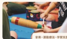
音楽・運動療法・学習支援