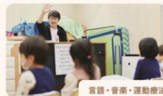
言語・音楽・運動療法