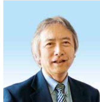
神戸聖隷福祉事業団