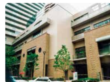
中部在宅障害者福祉センター

・西尻池シルバーハウジング ・LSA派遣事業(神戸市長田区)開所 ・グループホームながみね(神戸市灘区)開所