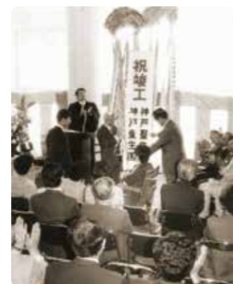
神戸聖生園・神戸愛生園開園