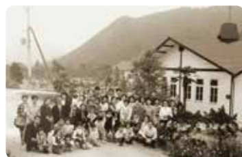
浜松の聖隷福祉事業団を訪問