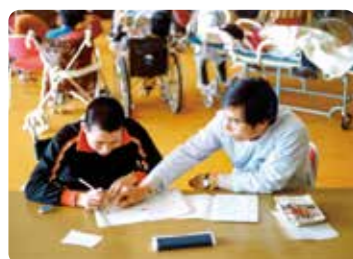
開園当初の真生園