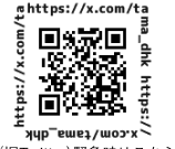
X (旧Twitter) 緊急時はこちら