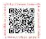
採用情報サイトはこちら