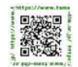
法人ウェブサイトはこちら