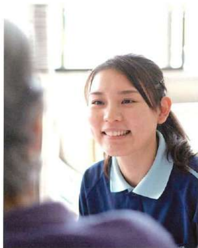
介護福祉士 K.A. 先輩

入職4年目。中学の頃から福祉の道を志し、新卒で寿泉会に入職。この春、念願の介護福祉士に合格。現在、インストラクターとして後輩の育成を任されている。高齢者に関わる仕事を長く続けたいと思っている。