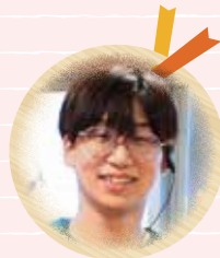
2020年入社 H・H ユニット介護職員 【介護福祉士2020年取得】

高齢者介護というと、大変な仕事というイメージを持つ人も多いと思います。実際、体力が必要だと感じる場面もあります。それでも、毎日の中にある入居者さんからのたくさんの 「ありがとう」 が、 私たちに大きなエネルギーを与えてくれます。 経験した者にしかわからないことかもしれませんが、「ありがとう」の一言で報われるのです。