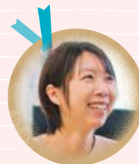
2015年入社 M・M ユニットリーダー 【介護福祉士2018年取得】

また、施設に入居すると自由がなくなるのでは…と心配されている方も多いと聞きます。けれど、ここは「その人らしい生活をできるだけ長く続けるため」にある施設。心身の状態さえ許せば外出も食事も自由にできますし、お酒を飲むこともできます。なので、少し難しいことや前例のないことを要望されても、どうすればできるかを考えるようにしています。先輩や他職種の職員からももらうアドバイスをもとに、 試行錯誤しながらいろいろな支援をできることが、やりがい です。自分が考えて行った支援に対し「ありがとう。Hさんがいてくれて良かった」と感謝してもらえたり、自分を信頼して「Hさんやから言うんやけど」と相談ごとを持ちかけてもらえるのは、自分の自信にもつながる大きな喜びです。 そうした喜びが毎日の中たくさんある から、私たちは頑張れるのだと感じています。