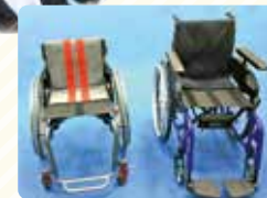
高性能モジュラー型車イス