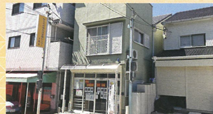
枚方市地域包括支援センター 大潤会

▶グループホーム いそしまⅠ【定員10名】 ▶グループホーム いそしまⅡ【定員10名】 ▶グループホーム めぐり【定員10名】