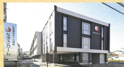
地域密着型特別養護老人ホーム なぎさカーム

▶地域密着型特別養護老人ホーム【定員29名】 ▶ショートステイ【定員10名】 ▶小規模多機能【登録29名】通所18名/宿泊9名