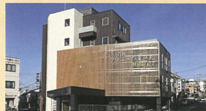
大潤会クリニック