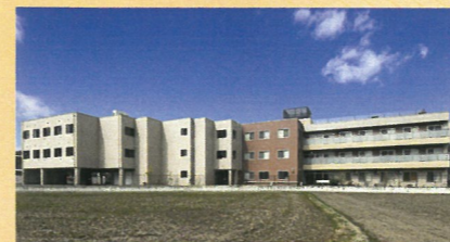
複合型介護施設 大冠カーム

▶特別養護老人ホーム【定員81名】 ▶デイサービスセンター【定員35名】 ▶障がい者生活介護【定員20名】 ▶相談支援事業所 大潤会