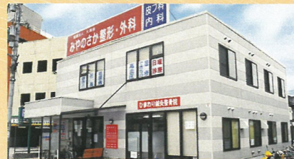
みやのさか整形・外科・ 皮膚科・内科