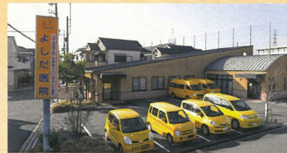
よした医院・歯科