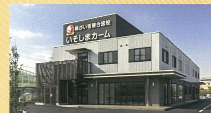
障がい者複合施設 いそしまカーム

▶小規模特別養護老人ホーム【定員29名】 ▶小規模ケアハウス【定員20名】 ▶小規模多機能【登録25名】 最大利用人数15名/宿泊5名 ▶グループホーム【定員18名】