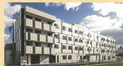
サービス付き高齢者向け住宅 めぐりカーム

▶地域密着型特別養護老人ホーム【定員29名】 ▶ショートステイ【定員10名】 ▶小規模多機能【登録29名】通所18名/宿泊9名