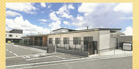
グループホーム カルマ

▶就労継続支援B型【定員40名】 ▶放課後デイサービス【定員10名】 ▶日中一時支援【定員10名】