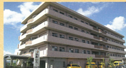
特別養護老人ホーム 御殿山カーム

▶特別養護老人ホーム【定員81名】 ▶デイサービスセンター【定員35名】 ▶障がい者生活介護【定員20名】 ▶相談支援事業所 大潤会