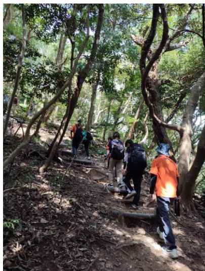
座学のあと出発です