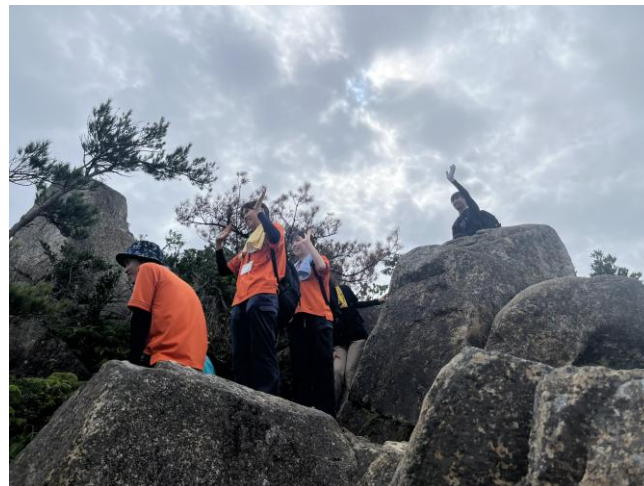
麓で待つ仲間に手を振ります