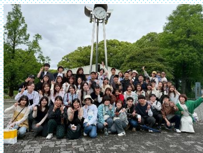
親睦イベントも充実

各施設での親睦イベントはもちろん、法人全体でも、BBQや運動会を開催し、交流を図っています。