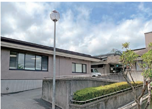
地域包括支援センター 外観

「まち」を基本理念として掲げています。この理念を実現する中心的な役割を担うのが、地域包括支援センターです。このたび、令和8年4月より、祥雲館（豊悠福祉会）がその運営を豊能町から受託いたしました。責務の重さを改めて感じるとともに、地域の皆さまへの思いを新たにしています。